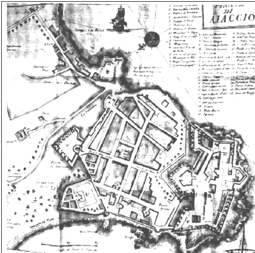
FIGURA N° 7 Antica Mappa di Ajaccio (XVIII secolo), Genova, Archivio di Stato