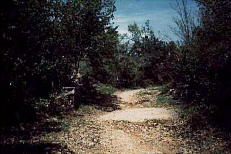
Figura 2: tratto della via Francigena nei pressi di Viterbo.