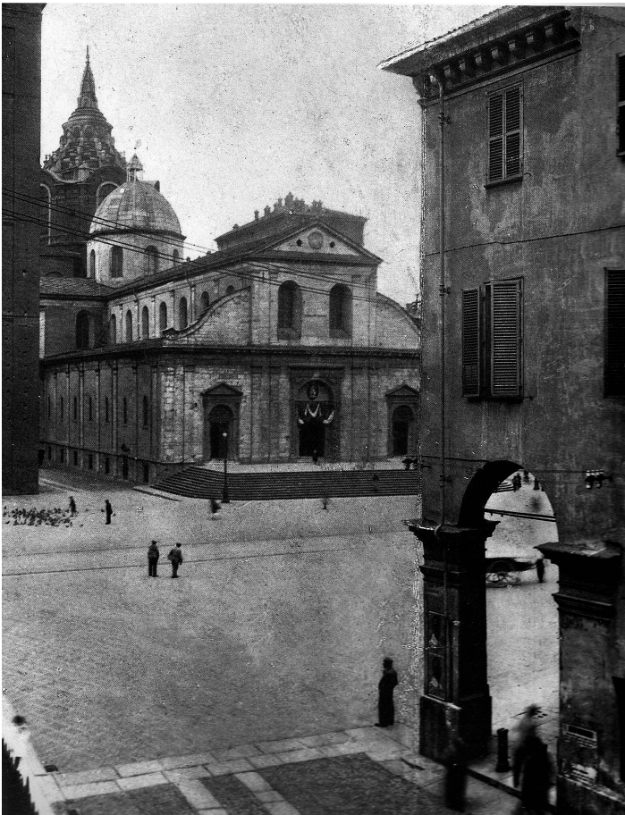
Torino, Duomo, 1870 ca.